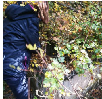
Slika 2. Izvor Jankovac