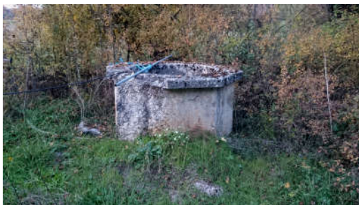
Slika 1. Izvor Josipovac

U planu je i uređenje dva izvora – Jankovac i Josipovac, naselje Kaniža (Sl. 1 i 2). U prvoj fazi radova uredio bi se okoliš oko navedenih izvora te postavile klupe za odmor. U drugoj fazi radova uredili bi se sami izvori tj. bunari te bi se postavili edukativni panoi (jedan pano kod svakog izvora).